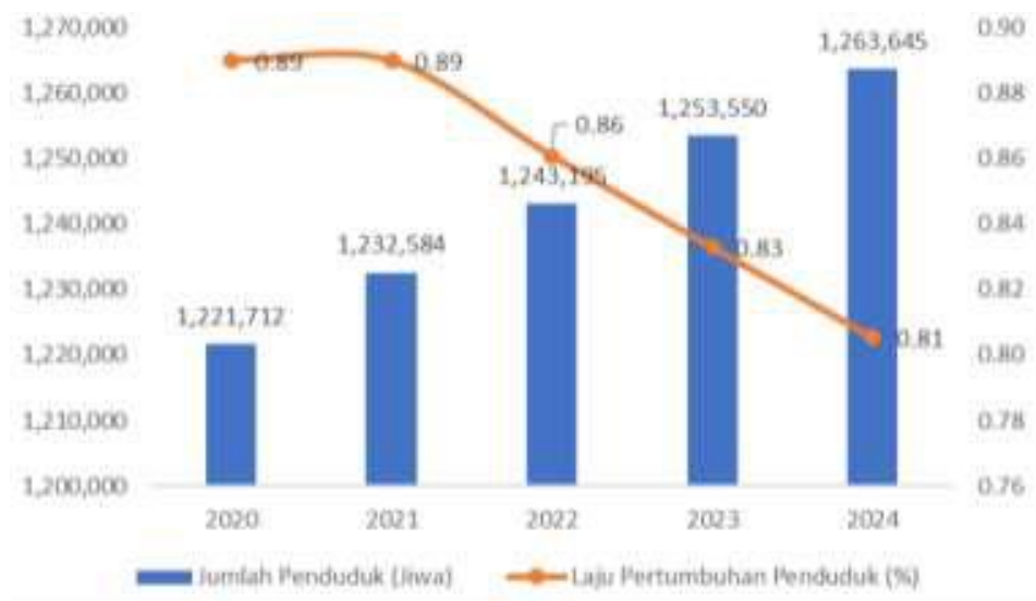
Jumlah dan Laju Pertumbuhan Penduduk Kabupaten Blitar Tahun 2020-2024 Sumber: BPS Kabupaten Blitar, 2024

pertahun dalam jangka waktu tertentu. Hal ini disebabkan karena adanya peristiwa kelahiran, kematian, dan perpindahan penduduk. Pada tahun 2024 jumlah penduduk Kabupaten Blitar sebanyak 1.263.645 jiwa atau mengalami pertumbuhan sebesar 0,81 persen dengan laju pertumbuhan penduduk perempuan lebih tinggi (0,87%) dibanding laju pertumbuhan penduduk laki-laki (0,74%). Laju pertumbuhan ini mengalami perlambatan dibanding tahun sebelumnya, Dimana pada tahun 2023 pertumbuhan penduduk sebesar 0,83 persen.